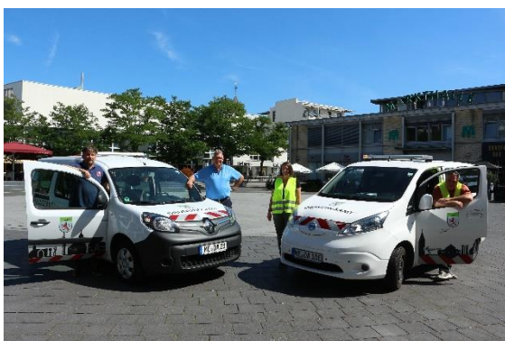
Elektrisch im Einsatz

Zur Sicherung der öffentlichen Sicherheit und Ordnung wird das Stadtgebiet sowohl durch die drei Politessen als auch durch die sieben Außendienstmitarbeiter des Referates Recht und Ordnung kontrolliert.