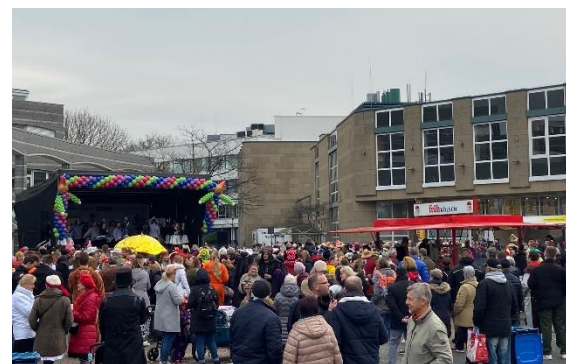
Start vor der Stadthalle

2023 startete auch der Straßenkarneval - nachdem Corona zwei Jahre entgegenstand - wieder in bewährter Weise durch.