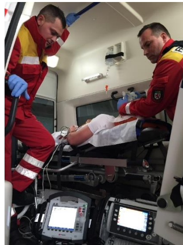
Professionelle Hilfe im Notfall

Brandmeister) wegfällt und sich damit das handwerkliche know-how in der Feuerwehr stark reduzieren würde. Dies ist aber für viele Einsätze sehr vorteilhaft. Dennoch werden auch ausgebildete Notfallsanitäter*in oder auch Krankenpfleger*in zum Einstellungstest für Brandmeisteranwärter eingeladen, die jedoch eine handwerkliche Geschicklichkeitsprüfung ablegen müssen.