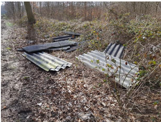
Abb. 3: Im Schwanenfeld/Segelflughafen

Durch Ihre aktive Mithilfe können Sie die Stadt bei der Ermittlung der Verursacher unterstützen. Jede Meldung, die zur Ermittlung des Verursachers führt, spart Kosten, die sonst von der Allgemeinheit zu tragen wären. Ihre Meldungen im städtischen Serviceportal tragen damit zur Erhaltung einer sauberen Stadt bei.