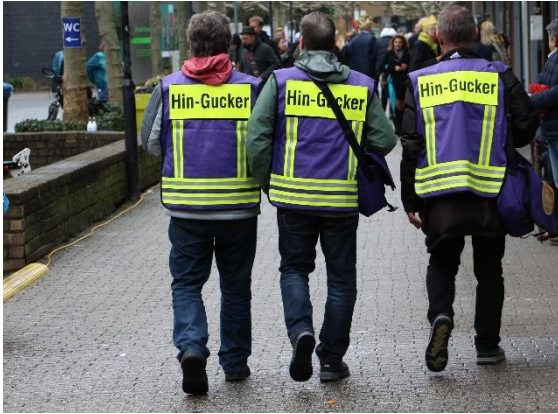
Drei Hingucker im Einsatz

Ziel dieses Projektes ist, jugendlichen Mädchen und Jungen Ansprechpartner*in zu sein und diese zu begleiten - nicht die direkte Ansprache an Jugendliche zu halten, um in Situationen einzugreifen. Die Erwachsenen sollen lediglich den Mädchen und Jungen in der entsprechenden Situation durch ihre bloße Anwesenheit das Gefühl von „Schutz“ vermitteln oder andere Helferinstitutionen informieren.