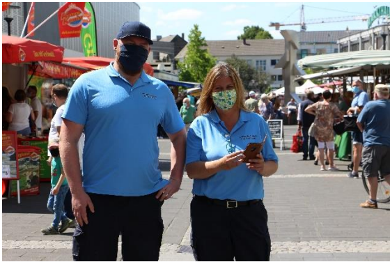
Maskenpflicht auf dem Markt

Auch auf dem Wochenmarkt musste reagiert werden. Die Stände wurden auseinandergesogen und zur Wahrung der Mindestabstände umgestellt, eine Maskenpflicht galt zeitweise und wurde durch das Ordnungsamt Langenfeld – unterstützt durch die Polizei - durchgesetzt.