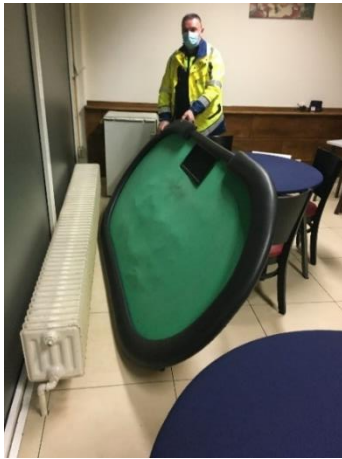
Pokertisch im Cafe

Im Februar 2023 konnte aufgrund einer anonymen Anzeige in einem Kiosk der Betrieb von zwei Geldspielgeräten und einem Sportwetterterminal aufgedeckt und gemeinsam mit der Kriminalpolizei beendet werden.