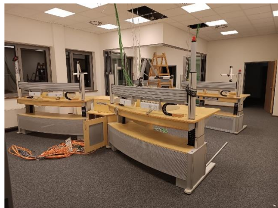
Die neue FEZ

Ebenso wie der Fahrzeugpark, wurde auch die Feuerwehreinsatzzentrale erweitert und komplett umgebaut. Nachdem nun auch richterlich bestätigt wurde, dass die Aufschaltung des Notrufs 112 der Stadt Monheim am Rhein auf die Einsatzzentrale der Feuerwehr Langenfeld rechtens ist, wird sowohl an der Erweiterung der Notrufleitungen und an der technischen Verbesserung der Anbindung der Wache Monheim weitergearbeitet. Ebenso wird die Koppelung der Einsatzzentrale an die Kreisleitstelle Mettmann vorangetrieben. Hierfür wurde ein Ingenieurbüro mit der konkreten Planung beauftragt. Ein weiteres Projekt ist die Umstellung des Sprech- und Datenfunks von analog nach digital. Dieses Vorhaben, als auch die Erweiterung der immer wichtiger werdenden Kommunikationssysteme, wird in Zukunft immer prägend sein.