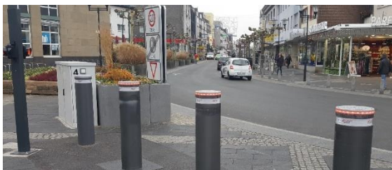
Poller an der Stadthalle

Das System lässt sich sowohl vor Ort, als auch über Bedienplätze am Ordnungsamt und der Feuerwehr steuern und ist seit November 2018 aktiv.