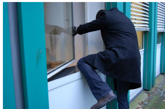
Wohnungseinbrüche lassen sich erschweren

Gerade durch Beratung kann man hier besonders gut vorbeugen. Das Ergebnis dieser Präventionsarbeit ist, dass gemessen an der Gesamtzahl der Wohnungseinbrüche der Anteil der Taten, die im Versuchsstadium stecken bleiben, permanent ansteigen. Das sind solche Einbrüche, bei denen der Täter die technischen Hürden und Einbruchshindernisse nicht schnell genug überwinden kann oder durch aufmerksame Nachbarn gestört wurde.