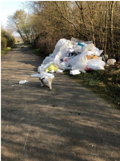
Abb. 2: Baumberger Straße

Durch Ihre aktive Mithilfe können Sie die Stadt bei der Ermittlung der Verursacher unterstützen. Jede Meldung, die zur Ermittlung des Verursachers führt, spart Kosten, die sonst von der Allgemeinheit zu tragen wären. Ihre Meldungen im städtischen Serviceportal tragen damit zur Erhaltung einer sauberen Stadt bei.