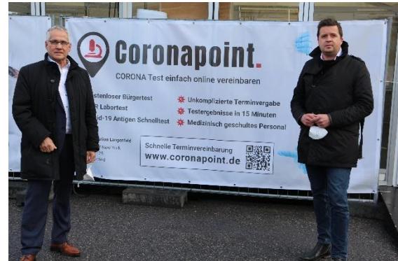
Teststation an der Stadthalle

Im Laufe der Pandemie weiteten einige Anbieter ihr Angebot auch auf die PCR-Test aus, ein Service, der die Abstrichstellen des Gesundheitsamtes entlastete.