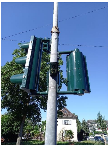
Blindenampel mit Akustikgeber

Bei der Anlage wird das akustische Signal immer ausgegeben, ohne dass erst ein Knopf gesucht und gedrückt werden muss. Ein langsames akustisches Signal (tok – tok – tok) hilft dabei, die Ampel aufzufinden. Es ertönt ein schnelles akustisches Signal, wenn die Ampel grün zeigt (piep-piep-piep).