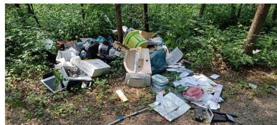
Abb. 1: Wilde Müllkippe – Zur Riethrather Mühle (Stadtgrenze Solingen)

Wilde Müllkippen verschandeln aber nicht nur optisch das Stadt- und Landschaftsbild, sondern sind auch verbotswidrige Handlungen. Nach dem Kreislaufwirtschaftsgesetz dürfen Abfälle nur in den dafür zugelassenen Abfallentsorgungsanlagen entsorgt werden. Aber auch die Lagerung von Abfällen auf dem eigenen Grundstück ist nicht zulässig, sofern das Grundstück nicht für diesen Zweck zugelassen ist. Verstöße, wie das Ablagern, Lagern, Verbrennen oder Wegwerfen von Abfällen außerhalb zugelassener Anlagen, werden von der Stadt verfolgt. Verunreinigungen werden als Ordnungswidrigkeiten mit einem Bußgeld geahndet und die Beseitigung auf Kosten des Verursachers veranlasst. Mit der Beseitigung illegaler Abfallablagerungen wird zum einen das Ziel verfolgt, die „Ordnungsmäßigkeit“ der Abfallentsorgung sicherzustellen und zum anderen und nicht zuletzt mit dem Ziel, vermeidbare Schädigungen, Belästigungen und Gefahren für die Umwelt und die Nachbarschaft zu verhindern.