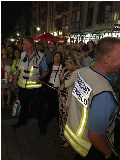
Sicherung in Karibiknacht

Die starke Präsenz führt seit mehreren Jahren zu rückläufigen Zahlen bei versorgungsbedürftiger Trunkenheit von Kindern und Jugendlichen in Langenfeld.