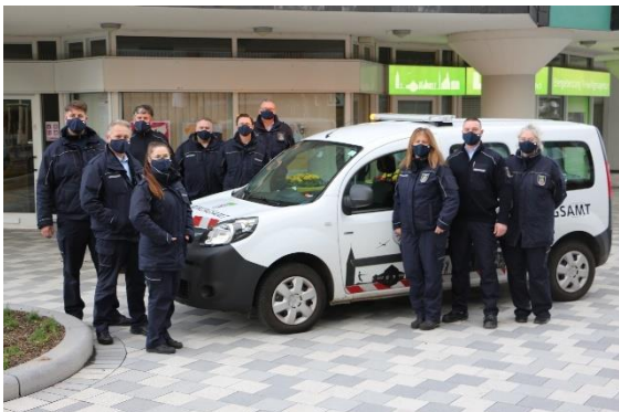
Zeitweise verfügte das Ordnungsamt über neun Außendienstkräfte

Mit dem Ende der Coronapandemie wurden zwei der vier befristeten Arbeitsverträge fortgesetzt, derzeit stehen im Außendienst daher sieben Vollzeitstellen zur Verfügung.