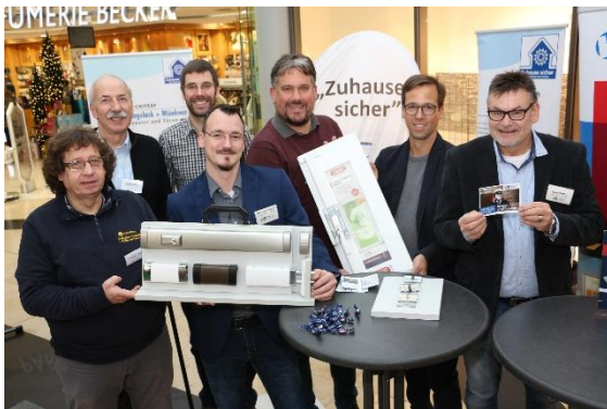
Beratung in der Stadtgalerie