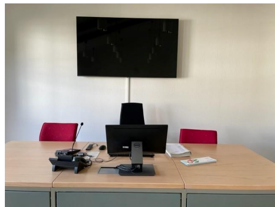
Sitzungssaal mit Bildschirm

Zudem erfolgt im Amtsgericht Langenfeld seit März 2022 eine Einführung der elektronischen Aktenführung nach und nach in den einzelnen Abteilungen. Damit vollzieht die Justiz einen großen Schritt hin zu einer modernen und zeitgemäßen Aktenführung. Die Sitzungssäle werden sukzessive mit entsprechenden technischen Einrichtungen wie großen Bildschirmen zur Anzeige von Aktenbestandteilen ausgestattet.