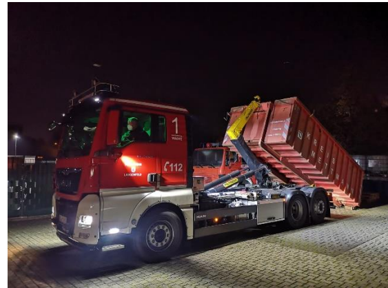
Der Wechsellader im Dienst

Die Konzeptionierung von Rollwagen und Abrollbehältern wird auch in den kommenden Jahren eine zentrale Aufgabe sein, um eine flexible und aufgabenspezialisierte Feuerwehr-Logistik zu ermöglichen.