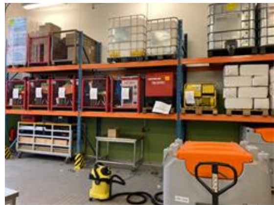
Lager für den Fall der Fälle

Dabei waren die Konzepte aus Langenfeld innovativ und für viele andere Städte richtungsweisend. Lieferengpässe führten dazu, dass die Beschaffungen jedoch noch bis heute andauern, da man auch für den kommenden Winter vorbereitet sein muss. Federführend für die strategische Planung war der Stab „GaStroWa“, der durch den Fachbereich 2 (neben der FBL im Wesentlichen die Referate 230 und 250) gestellt wurde.