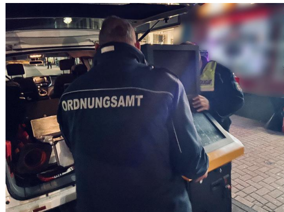
Mitnahme von illegalen Geräten

Im Mai 2023 besuchten Einsatzkräfte nach einer gemeinsamen Schulung mit Polizei und dem Ordnungsamt Hilden die Langenfelder Spielhallen und zwei Gaststätten – während in den Spielhallen alles in Ordnung war, wurde in einer Gaststätte ein Verstoß gegen das Nichtraucherschutzgesetz geahndet und eine Festnahme wegen aufenthaltsrechtlicher Verstöße erforderlich. In der anderen Gaststätte waren die Prüfplaketten an den Geldspielgeräten abgelaufen. Ein Bußgeld war die Folge.