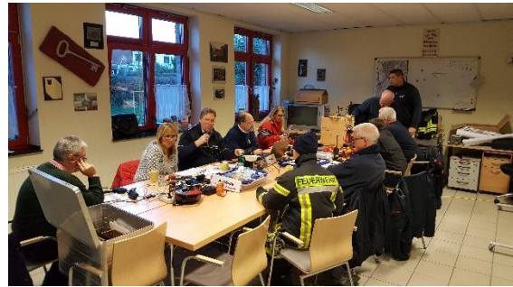
Koordinierungsteam in Reusrath

. Gesteuert werden diese durch das Koordinierungsteam von Polizei, Ordnungsamt, Feuerwehr, Veranstalter und Hilfsorganisationen. Hierhin bestand Funkkontakt zu allen Einsatzkräften und allen Fahrern der LKW-Sperren. Identisch wurden auch der Berghausener Veedelszug und der Reusrather Lichterzug gesichert.