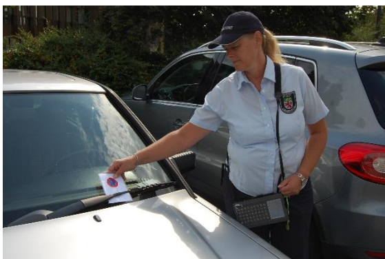
Politesse im Dienst

Neu eingeführt wurde die Erfassung von Verkehrsverstößen mit Smartphones. Statt der schweren Erfassungsgeräte nutzen die Politessen und der Außendienst nun die vorhandenen Smartphones für die Eingabe der erforderlichen Daten und das Fotografieren der Parkverstöße. Der Innendienst kann dann unmittelbar die Daten abrufen und Nachfragen verwarnter Parksünder unverzüglich beantworten. Sogar eine sofortige Prüfung der einzelnen Sachverhalte ist nun möglich, so dass die Sachbearbeiterin der Bußgeldstelle das Personal vor Ort noch auffordern kann, weitere Beweise zu sichern. Mit Bluetooth-Druckern werden dann die Verwarnungen auch weiterhin am Fahrzeug angebracht, lediglich auf die Überweisungsträger wird seit der Umstellung verzichtet.