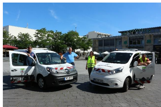
Elektrisch im Einsatz

Die mit „Ordnungsamt“ beschrifteten Autos sind zusätzlich beklebt mit der Langenfelder Skyline sowie rot-weißen Warntafeln und entsprechen damit dem aktuellen Designkonzept des städtischen Fuhrparks. Der elektrische Kleinbus ermöglicht zudem die Mitnahme von bis zu 7 Dienstkräften beispielsweise an Karneval und den Umbau zu einer mobilen Einsatzleitung.