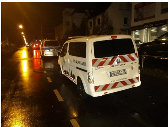
Einsatz mit der Polizei und dem Ordnungsamt

Erneut am 26.1.2019 wurden die Spielhallen und Gaststätten in Langenfeld kontrolliert und vorgefundene Geldspielgeräte überprüft. Dieser Einsatz erfolgte im Rahmen der andauernden polizeilichen Einstufung des Immigrather Platzes nach § 12 PolG NRW als „Gefährlicher Ort“. Zudem wurden ein Sportwettbüro an der Solinger Straße, zwei Gaststätten und eine Shisha-Bar an der Richrather Straße kontrolliert.