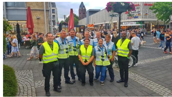
Kontrollen auf der Karibiknacht

Zudem müssen die festgelegten Maßnahmen im Bereich vorbeugender Brandschutz, Fluchtwege und bauordnungsrechtliche Vorgaben gemeinsam mit der Feuerwehr und der Unteren Bauaufsicht abgenommen werden.