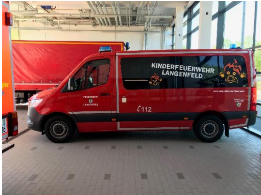
Sprinter der Jugendfeuerwehr

Im Bereich der Feuerwehrfahrzeuge wurde u.a. ein Mannschaftstransportfahrzeug auf Mercedes-Sprinter-Basis für die neu gegründete Kinderfeuerwehr beschafft, wobei diese Investition zu größten Teilen vom Land NRW subventioniert wurde.