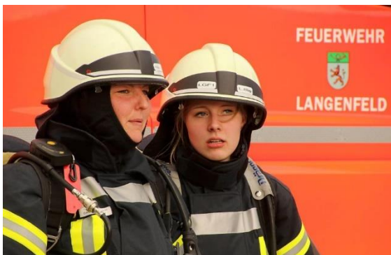
Kolleginnen in voller Montur

Die jährlich 555 technischen Hilfeleistungen spielen im täglichen Ablauf der Feuerwehr schon eine größere Rolle. Dabei werden Menschen und Tieren aus Gruben, Schächten oder aus feststehenden Aufzügen befreit, werden bei einem schweren Verkehrsunfall in einem Fahrzeug eingeklemmten Personen gerettet, werden Ölsuren auf Verkehrsflächen beseitigt, werden Wehre zur Beseitigung von ölhaltigen Flüssigkeiten auf Wasseroberflächen errichtet, werden Gefahren durch Wasser- und Sturmschäden, bei Einsturzgefahr, bei Gasausströmungen und Chemieunfällen beseitigt, Tiere aus Notlagen gerettet und vieles mehr.