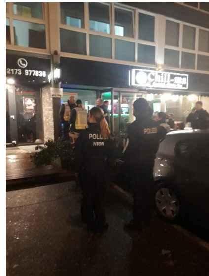
Überprüfung einer Shishabar

Die Kontrolleure legten insgesamt 13 Glücksspielautomaten still und versiegelten diese. Vier besonders manipulierte Automaten wurden von der Polizei zur Beweisführung im eingeleiteten Strafverfahren sichergestellt und abtransportiert.