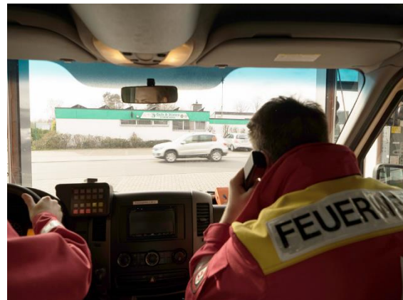
Der RTW rückt aus

Ab Herbst 2020 wird der Krankentransport nicht mehr durch die Feuerwehr, sondern durch den Arbeiter-Samariter-Bund und den Malteser-Hilfsdienst wahrgenommen. Das so freigestellte Personal wird dadurch aber nicht „überflüssig“, sondern besetzt einen Tagesrettungswagen (werktags, 07:00 – 19:00 Uhr), der im Rettungsbedarfsplan festgeschrieben steht, der bislang aus personellen Gründen nicht besetzt werden konnte. Diese Lücke schließt sich nun.