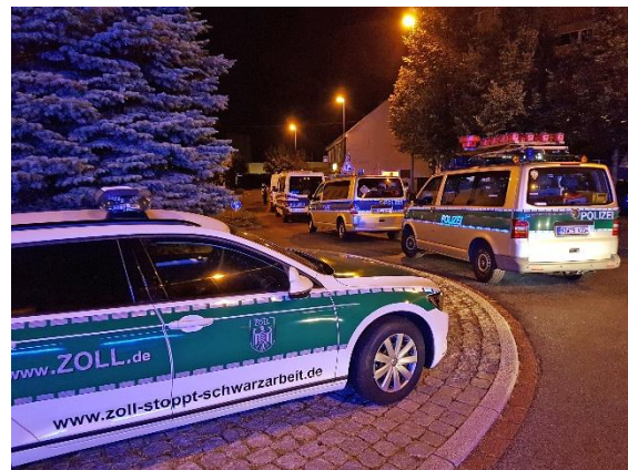
Großaufgebot von Zoll und Polizei

105 Personen in den Objekten und deren Umfeld wurden überprüft. Neun Strafverfahren, unter anderem wegen einem Verstoß gegen das Betäubungsmittelgesetz und wegen illegaler Beschäftigung, wurden eingeleitet. Außerdem wurden wegen diverser anderer Verstöße 37 Ordnungswidrigkeiten zur Anzeige gebracht.