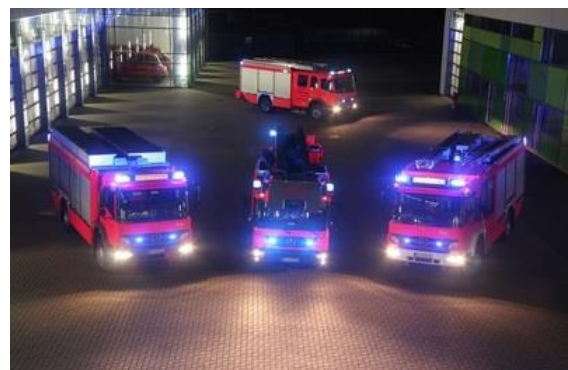
Fuhrpark auf der Wache

Langenfeld verfügt als mittlere kreisangehörige Gemeinde über eine Freiwillige Feuerwehr mit hauptamtlichen Kräften. Der Begriff der Berufsfeuerwehr ist grundsätzlich den großen kreisangehörigen oder kreisfreien Städten vorbehalten, gleichwohl sind die Langenfelder hauptamtlichen Kräfte hoch spezialisierte und hervorragend ausgebildete Berufsfeuerwehrleute, die die gleiche Ausbildung durchlaufen haben.