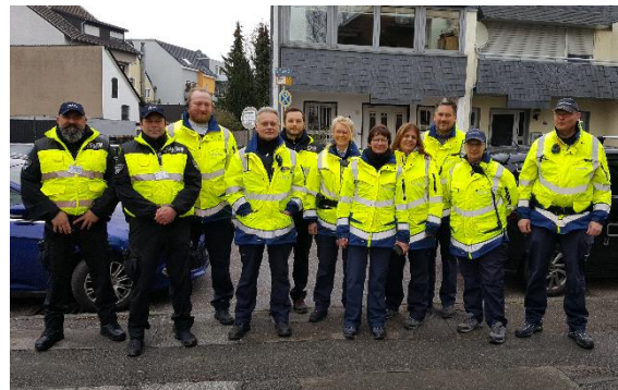
Präsenzkräfte im Karneval

2020 musste das Koordinierungsteam wegen des Sturms den Berghausener Zug verlegen – so kam es zum ersten Rosenmontagszug in Langenfeld.