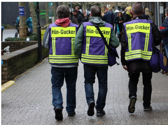
Drei Hingucker im Einsatz

Die Hin-Gucker sind außerdem mit Notfalltelefon-Nummern der Einsatzkräfte der Polizei und des Ordnungsamtes, Taschenlampen und kleinen Reisenotfalltaschen ausgestattet.