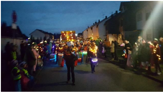
Lichterzug in Reusrath

. Gesteuert werden diese durch das Koordinierungsteam von Polizei, Ordnungsamt, Feuerwehr, Veranstalter und Hilfsorganisationen. Hierhin bestand Funkkontakt zu allen Einsatzkräften und allen Fahrern der LKW-Sperren. Identisch wurden auch der Berghausener Veedelszug und der Reusrather Lichterzug gesichert.