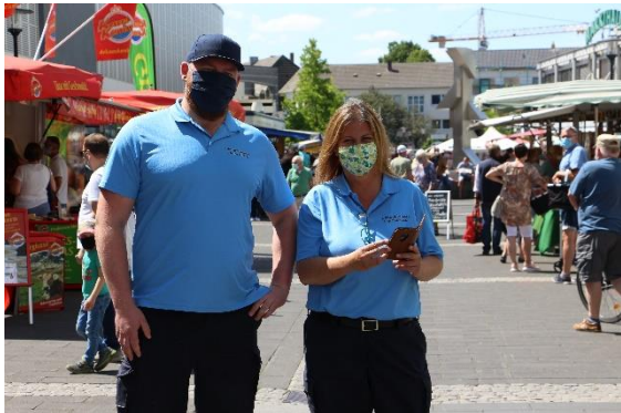
Maskenpflicht auf dem Markt

Zwischenzeitlich beruhigte sich die Lage etwas, ist aber im Herbst 2020 wieder von einem starken Ansteige der Infektionsfälle geprägt. Bei Drucklegung war die befristete Einstellung vier weiterer Dienstkräfte im Außendienst und der Aufbau zweier Innendienststellen beschlossen.