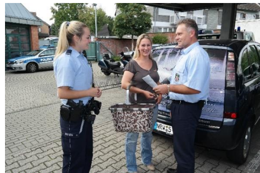
Doppelstreife für den Bürger unterwegs

Gemeinsam mit dem Bezirksdienst der Polizei finden anlassbezogen weiterhin Doppelstreifen im Stadtgebiet statt. Sowohl bei gemeinsamen Einsätzen an Schulen und Kindergärten zur Regelung und Überwachung des Verkehrs, als auch bei Streifen auf dem Wochenmarkt und im übrigen Stadtgebiet sind Ansprechpartner aus beiden Behörden für Bürgerinnen und Bürger präsent.