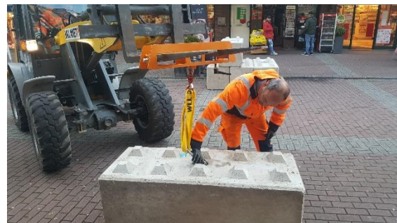
Mobiler Betonschutz im Aufbau

Die Absicherung von Veranstaltungen zum Schutz vor Terroranschlägen hat in der Vergangenheit immer mehr Bedeutung gewonnen auch, wenn die erforderlichen Sicherungsmaßnahmen i.d.R. mit hohem Aufwand verbunden sind. So mussten nach den Terrorereignissen in Berlin, Nizza und Barcelona alle Veranstaltungen mit LKW-Barrieren, Schleusen aus Containern und Wassertanks zusätzlich gesichert werden.