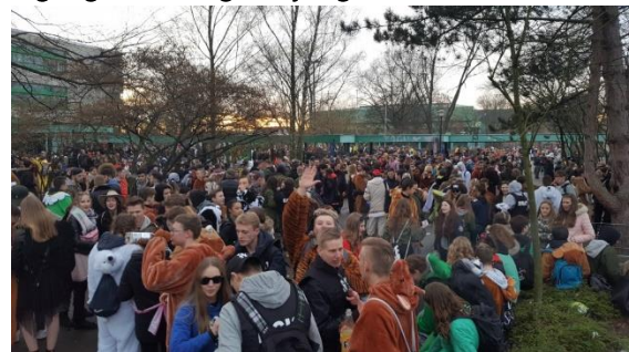
Bilder der Vergangenheit

Seit mehreren Jahren wurde festgestellt, dass insbesondere auf dem innenstadtnahen Schulhof des Konrad-Adenauer-Gymnasiums anlässlich der Karnevalsfeiern an Altweiber und am Samstag aber auch zur Karibiknacht ungenehmigte Feiern/Treffen von Jugendlichen mit erheblichem Alkoholkonsum und starken Verunreinigungen / Vandalismus stattfinden, aber auch gesundheitsschädlicher Eigengefährdung der jungen Leute .