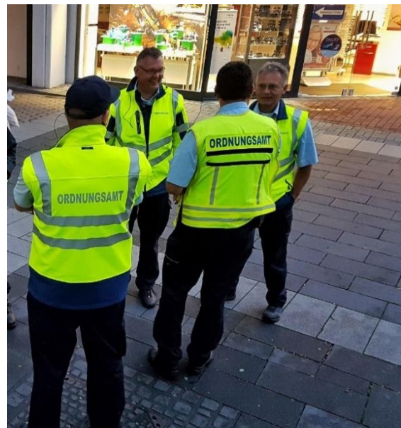
Sichtbar im Stadtgebiet

Die Mitarbeiter des Außendienstes sind die augenfälligste Präsenz der Stadt Langenfeld; in der den blauen Uniformen mit der Aufschrift Ordnungsamt gehören die Außendienstmitarbeiter mittlerweile zum Stadtbild dazu, sei es zu Fuß, mit den Dienstfahrrädern oder den beiden Dienstwagen. Zur Sicherung der öffentlichen Sicherheit und Ordnung wird das Stadtgebiet sowohl durch die drei Politessen als auch durch die vier Außendienstmitarbeiter des Referates Recht und Ordnung kontrolliert.