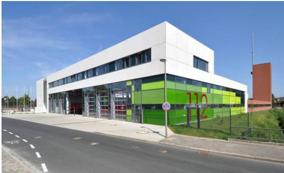
Die Hauptfeuer- und Rettungswache

schaffen. Erste Gedanken und Ideen hierzu gibt es bereits.