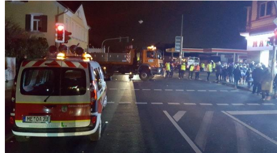
Blockaden in Reusrath

Für Veranstaltungen außerhalb der Fußgängerzone muss übrigens immer noch auf die bewährten mobilen Schutzmaßnahmen zurückgegriffen werden – z.B. im Karneval.