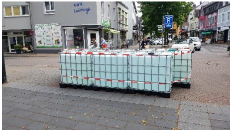
Wassertanks in der Stadt

Daher wurde der Beschluss gefasst, die Langenfelder Fußgängerzone mit einem fest installierten System auszustatten, denn die Innenstadt ist Austragungsort vieler Veranstaltungen und an zwei Tagen die Woche findet ein Markt statt. Als weitere positiver Aspekt kann durch diese Maßnahme die Nutzung der Fußgängerzone durch Fremdverkehre minimiert werden wodurch die Sicherheit für die Fußgänger deutlich erhöht wird.