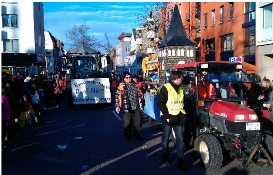
Zug des Festkomitees

Seit 2012 wird der Außendienst des Ordnungsamtes in der Innenstadt und beim Lichterzug in Reusrath durch Mitarbeiter einer Sicherheitsfirma ergänzt. Die Mitarbeiter dieser Firma begleiten das Ordnungsamt aus Gründen des Eigenschutzes, werden aber selber nicht hoheitlich tätig. Insgesamt erhöht dies aber die Präsenz der kommunalen Sicherheitskräfte und erleichtert die Arbeit des Referates Recht und Ordnung.